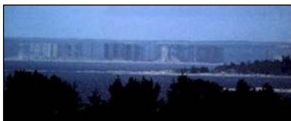
Auteurs inconnus – Fata morgana

Le mirage est attribué à la présence, à différents niveaux de l'atmosphère, de couches d'air où se produisent des variations thermiques plus ou moins brutales. La présence d'îles doit vraisemblablement le favoriser, on sait en effet que la terre et les roches changent de température beaucoup plus rapidement que l'eau. Les rayons suivent alors des trajectoires pratiquement imprévisibles et diversement entrelacées.